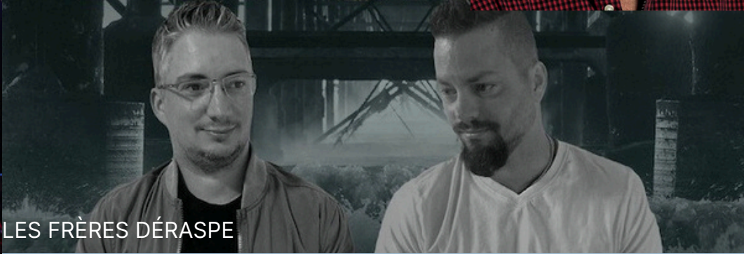
LES FRÈRES DÉRASPE